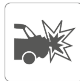
Essai au chocs approuvé