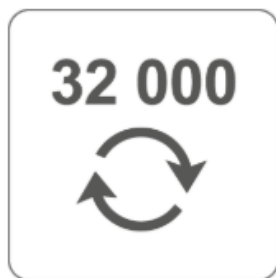
Essai de cycle approuvé