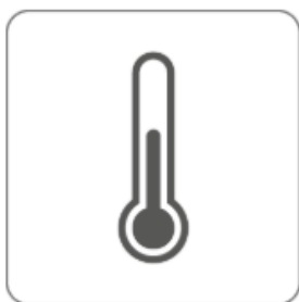
Essai climatique approuvé